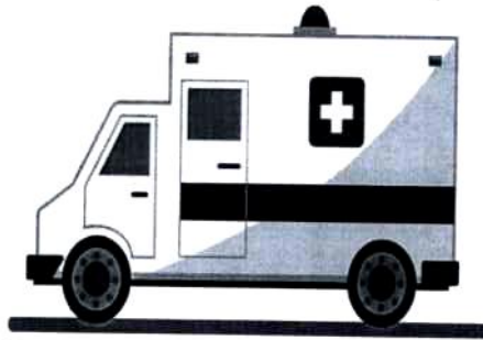
Скорая в т.ч. скорая специализированная помощь