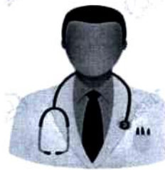
Первичная медико - санитарная помощь, в том числе первичная доврачебная и первичная специализированная помощь